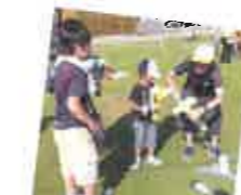
飛ばせ！ペットボトルロケット